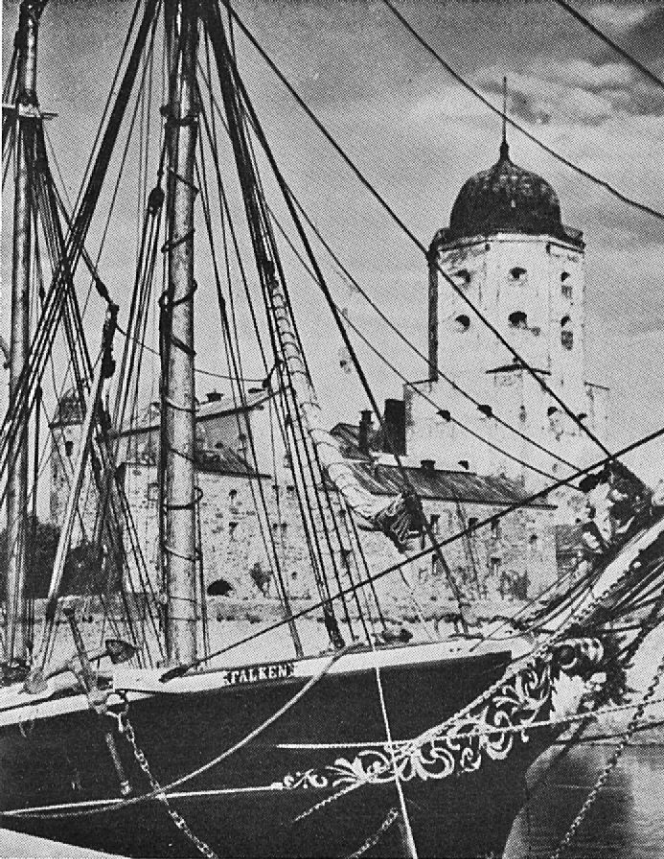
Château de Viipuri