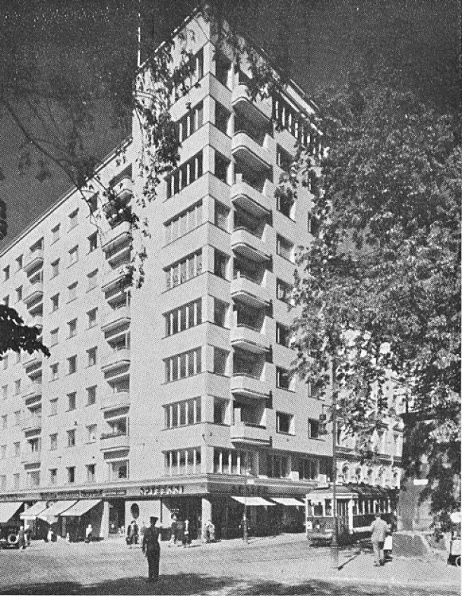
Immeuble commercial à Helsinki