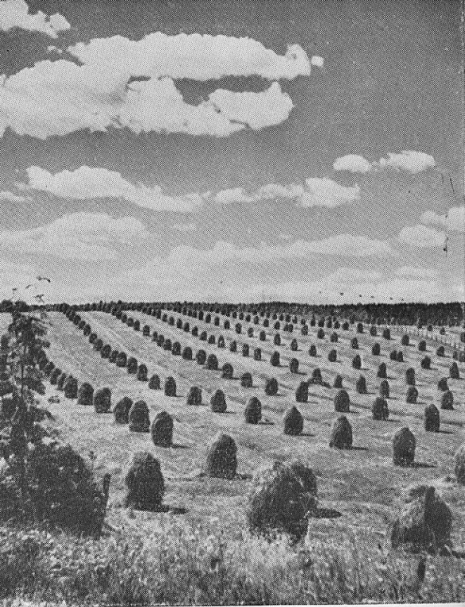
Paysage agricole de la Finlande méridionale