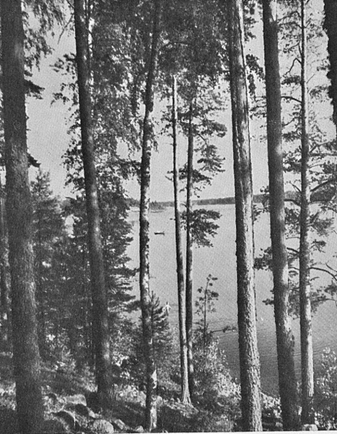
Paysage lacustre de la Finlande centrale