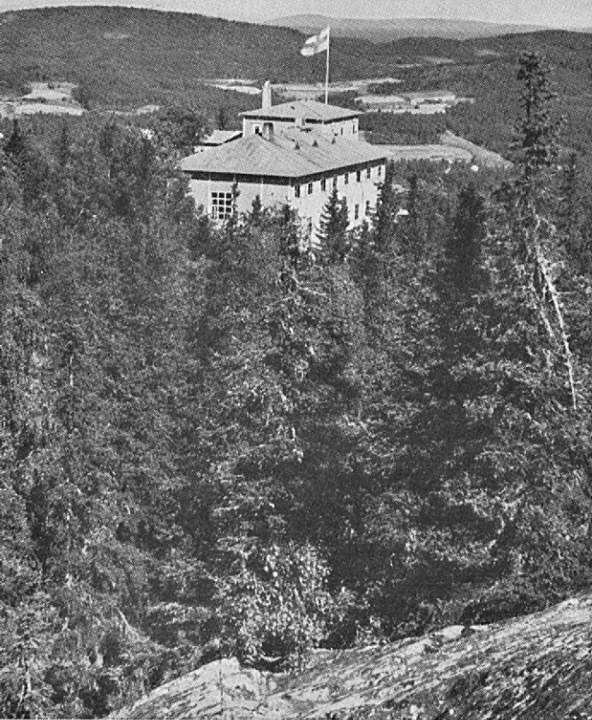
Hôtel de tourisme à Koli