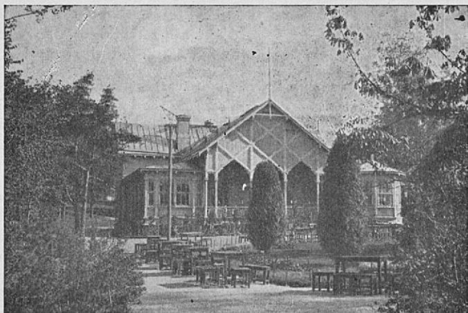
Högholmens restaurang.

Sedan vi här rekreerat oss med ett bad begiva vi oss längs vägen, som leder utmed holmens sydsluttning, förbi kamelgården till den höga bergsknall, varest mineralsamlingen finnes (60). På detta kan man njuta av den härliga utsikten medan man inväntar nästa båttur till staden.