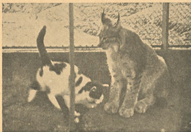
Högholmens lodjur "Misse" med sin "lillemor" fotograferade 1934.