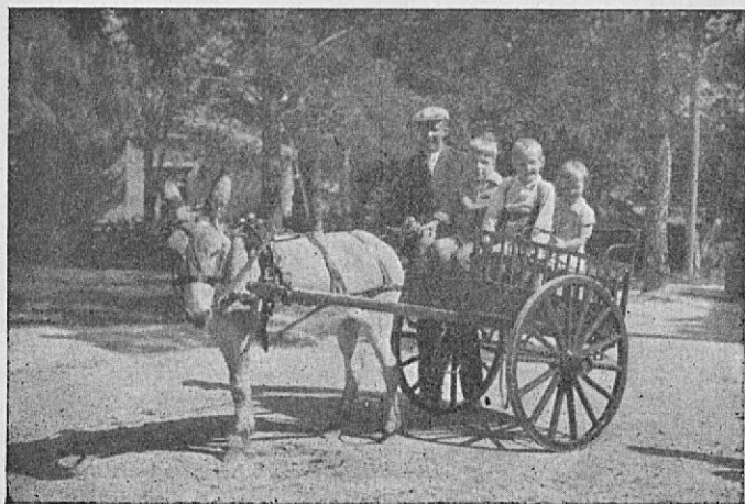
Åktur med åsna.

Eventuella klagomål kunna framställas samt förfrågningar göras å holmen hos intendenten för djurgården eller hos disponenten för folkparkerna.