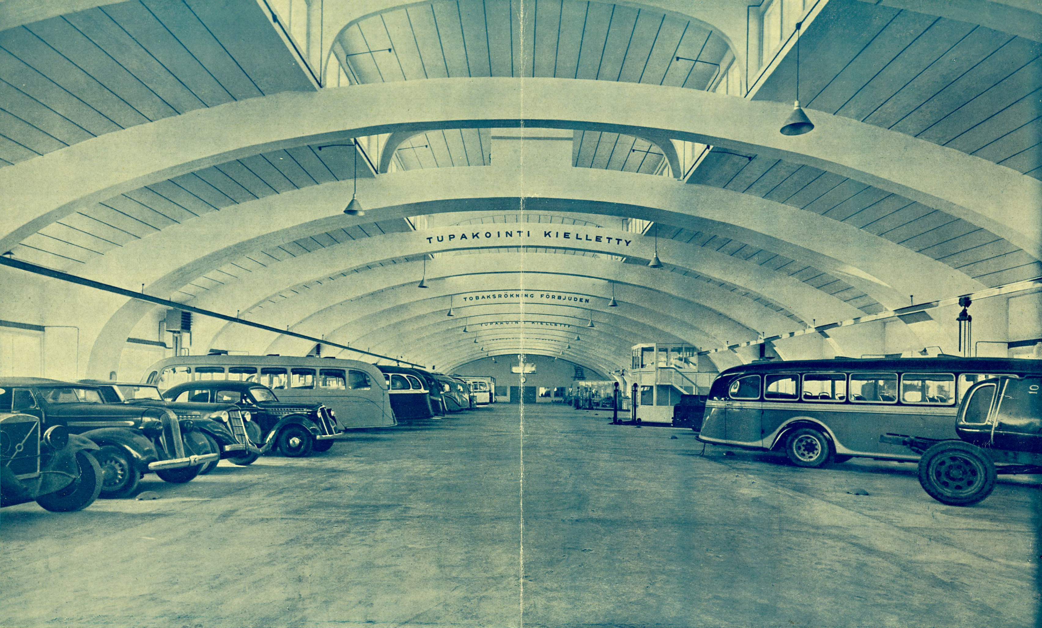
Den stora, ljusa verkstadshallen med en golvyta av 2400 m 2 . Uppvärmningen och ventilationen är mycket effektiv. I golvet finns särskilda anordningar för utsugning av avloppsgas, varigenom 20 motorer kunna gå samtidigt utan att luften i hallen försämras. Ett tiotal hydrauliska lyftare betjäna olika avdelningar såsom snabbtvätten, smörjningen, arbetsschakten o. s. v. Tryckluftsuttag finns överallt. Å bilden synes i mitten av hallen på högra sidan verktygsutgivning, ovanför vilken verkmästarna ha sitt kontor. Bortom detta är verkstadschefens kontor beläget. Mitt i fonden ser man dörrarna till reservdelslagret. Under den ovan avbildade hallen är en lika stor våning som upptages av måleri, snickeri, smedja, oljeupplag, produktionslager, generator-snabbservice o. a. lokaliteter.