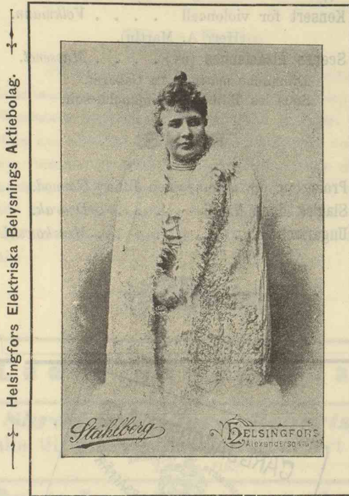
Helsingfors Elektriska Belysnings Aktiebolag.