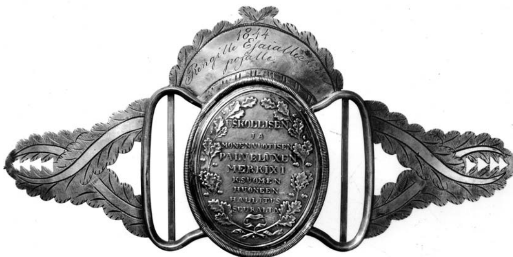
Hushållningssällskapets hattspänne som togs i bruk år 1844.