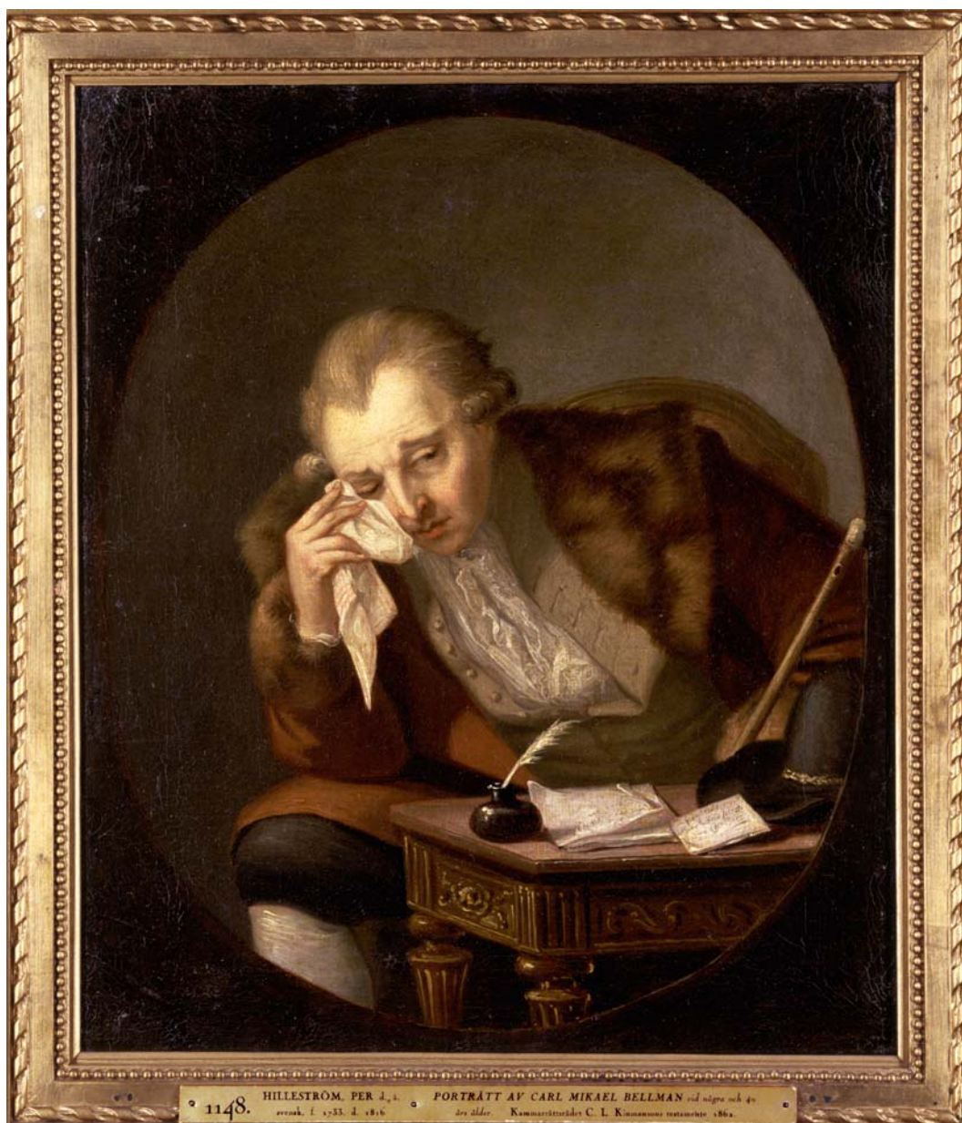
C. M. Bellman med Patriotiska Sällskapets hattband eller hattkedja av silver. Målningen av Pehr Hilleström. (Nationalmuseum, Sverige)