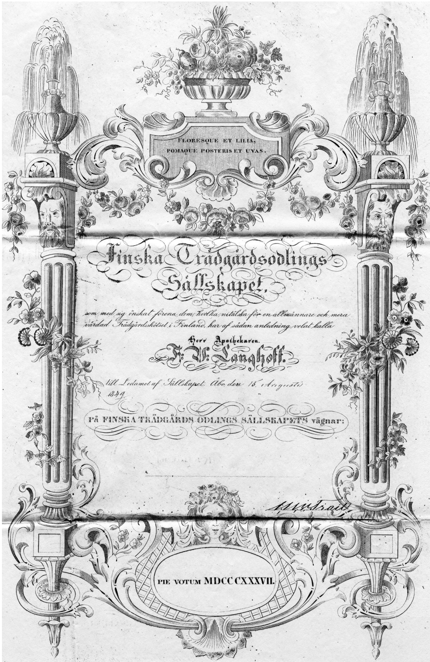
Illustration av Finska Trädgårdsodlingssällskapets kallelsebrev ”Enligt stadgarna skulle varje medlem tillställas ett kallelsebrev och Rehbinder ägnade dess utformning stort intresse”.