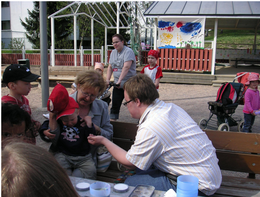
KUVIO 7. Taiteilija työssään: Haavikon opiskelija taiteilemassa kasvomaalauksia.

Kasvomaalauspiste oli aidatun alueen portin vieressä, puiston pöydän ääressä. Kasvomaalit, pensselit, paperit ja vesikupit saimme Leikkipuisto Maunulasta. Pöydän suojaksi levitimme vahakankaan. Pelkän kasvokuvan haluavat lapset sekä aikuiset pääsivät helposti kulkemaan käynnissä olevia kierroksia häiritsemättä kasvomaalauspisteelle. Suurimman osan ajasta pisteessä työskenteli kaksi henkilöä kerrallaan, mikä tarkoitti tauotonta työtä molemmille. Kiireisimmässä vaiheessa maalaamiseen osallistui myös leikkipuiston työntekijä, joka oli Maunulatiimin jäsen sekä yksi Monikulttuurisuuspäivässä toimivista organisaattoreista.