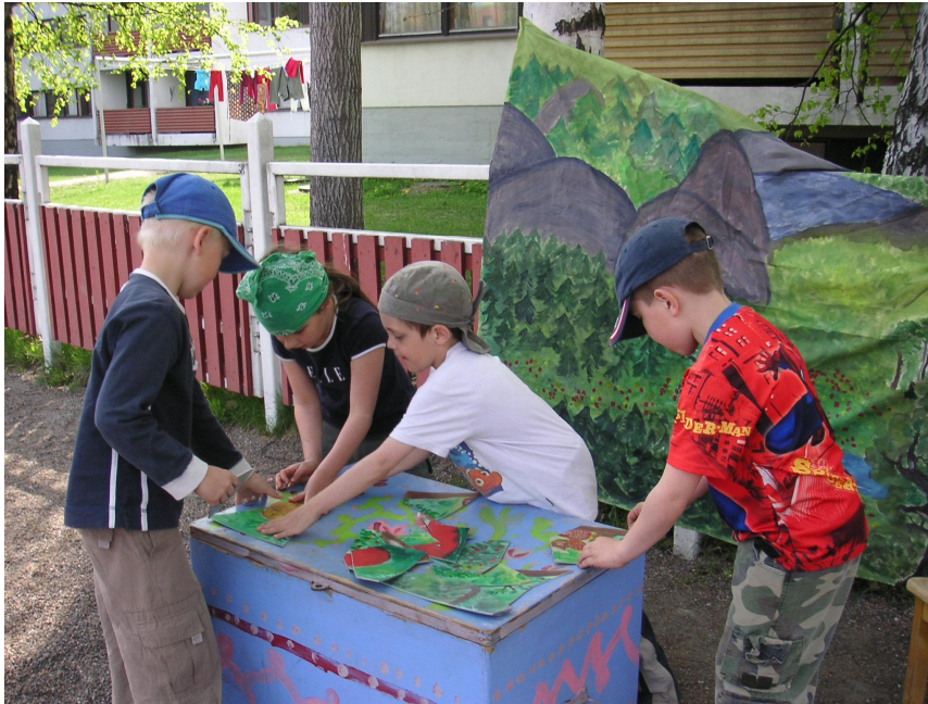
KUVIO 4. Palat sekaisin: Palapeliä kootaan arvoituksia kuunnellen.

Ennen kolmatta pistettä lasten täytyi selviytyä ”jättiläishämähäkinverkosta” ja matkan varrella olevista kulkua haittaavista esteistä. Lisäksi lasten täytyi ”kaataa bambuja appelsiineilla heittäen”. Hämähäkinverkko oli leikkipuistosta lainattu lentopalloverkko, jonka olimme sitoneet puihin heti arvoitus- ja yhteistyöpisteen jälkeen. Verkon jälkeen maahan oli Haavikon opiskelijoiden ehdotuksesta asetettu poikittain neljä isoa puupölkkyä sekä isoja kantoja. Sivummalla rekvisiittana oli noin metrin korkeita puusta veistettyjä eläinpatsaita. Haavikon opiskelija odotti lapsia puusteiden jälkeen ja ohjasi heidät kaatamaan bambumetsää. Bambut olivat puisia keiloja ja appelsiinit tennispalloja. Haavikon opiskelijan tehtävänä oli jakaa lapsille palloja. Kun lapset olivat heittäneet palloilla keilat kumoon, vastuuhenkilö nosti keilat takaisin pystyyn sekä keräsi pallot odottamaan seuraavaa ryhmää.