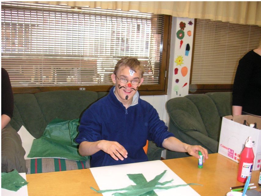
KUVIO 8. Tekemisen iloa: Lavasteet syntyvät hymyssäsuin.

Pidimme yllä hyvää ilmapiiriä kannustamalla sekä antamalla hyvää palautetta Haavikon opiskelijoiden osallistumisesta. Ennakkovalmistelupäivien aikana tutustuimme henkilökohtaisesti opiskelijoihin, jolloin yhteistyö oli kaikkien kannalta helpompaa. Järjestämämme toiminta perustui tasa-arvoisuuteen eikä tietojen ja taitojen taso määritellyt osallistujien roolia tai vaikuttanut heidän osallistumiseensa tai panokseensa ryhmässä millään lailla. Tarkoituksena oli myös tuoda yhteisöllisen päivän tunnelma sekä viidakokoseikkailun teema konkreettisesti Haavikon opetus- ja aikuiskasvatuskeskukseen, jotta osallistuminen olisi kaikille elämyksellistä. Meillä oli yhteensä kaksi tuntia varattu lavasteiden ja kasvomaalausten tekemiseen. Aika oli sopiva Haavikon opiskelijoiden keskittymiskyvyn kannalta. Sen sijaan aika ei riittänyt viidakkoteeman käsittelemiseen syvällisemmin. Olisi ollut hyvä järjestää Haavikossa tutustumiseen ja tunnelmointiin oma päivä sekä askarteluun ja käytännön toimintaan oma päivänsä.