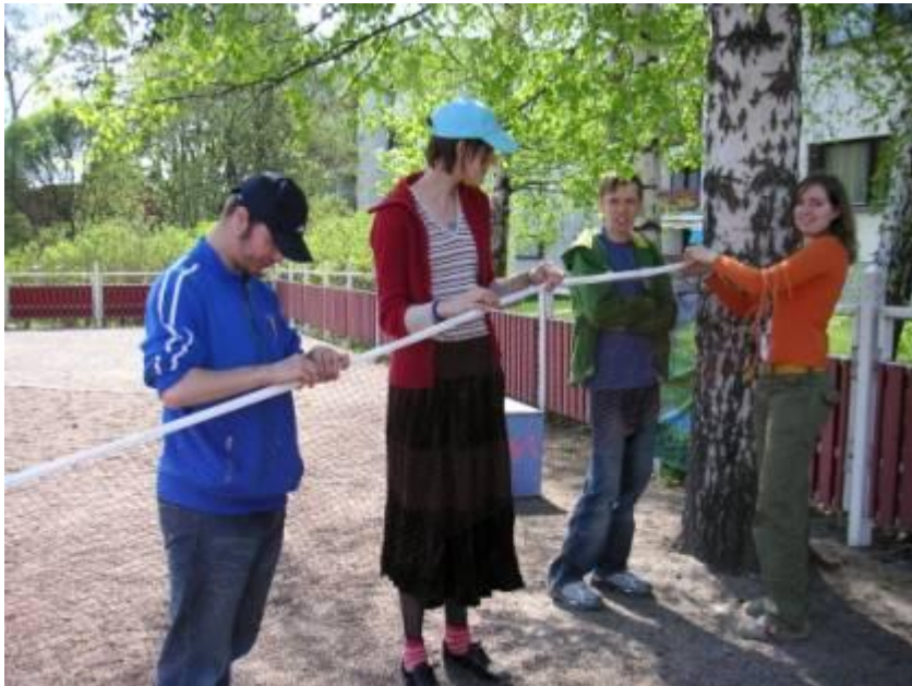
KUVIO 9. Yhtä köyttä vetäen: Haavikon opiskelijat valmistelemaan viidakkoseikkailua.

Seikkailun saavuttaman suosion sekä runsaan osallistujamäärän vuoksi Haavikon opiskelijat saivat suunniteltua enemmän vastuuta oman roolimme opiskelijoiden ohjaajina jäädessä aiottua pienemmäksi. Oli mukava huomata, että opiskelijat tekivät yhteistyötä myös keskenään ilman meidän jatkuvaa ohjausta. Alustava roolien jako sekä suunnittelu tukivat ohjausta sekä selkiyttivät Haavikon opiskelijoiden omaa roolia suurten lapsiryhmien viedessä valtaosan huomiostamme. Iloksemme huomasimme Haavikon opiskelijoiden tilannesensitiivisyyden; he määrittivät nopeasti omat tehtävänsä sekä toimivat rohkeasti ja itsenäisesti tilanteen vaatimalla tavalla. Jokainen lunasti paikkansa viidakkoseikkailussa oma-aloitteisuudellaan sekä johdonmukaisella toiminnallaan. Opiskelijat saivat tapahtumassa toivomamme aikuisen roolin. Lapset keskittyivät ja kuuntelivat innokkaasti myös heidän ohjauksessaan. Ilman Haavikon opiskelijoiden osallistumista seikkailun toteutus olisi jäänyt vaillinaiseksi sekä värittömäksi. Heidän aktiivinen työkentelynsä takasi radan tauottoman kulun. Päivän aikana syntyi yhteishenki ja ilmapiiri oli myönteinen.