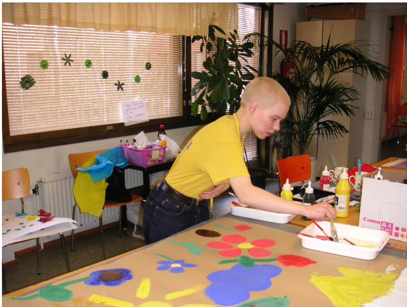
KUVIO 1. Värien leikkiä: Lavasteiden teko Haavikossa oli tarkkaa puuhaa.

Yksi ryhmä maalasi valinnaisesti kankaalle, kartongille tai paperille viidakkoaiheisia kuvia isojen pöytien ääressä meille varatussa Haavikon taukotilassa. Toinen ryhmä harjoitteli ohjatusti kasvomaalausten tekemistä luokkahuoneissa. Kasvomaalausharjoitus alkoi kuivaharjoittelulla valkoisella paperilla, johon oli hahmoteltu ihmisen kasvot. Jokainen pääsi suunnittelemaan ja harjoittelemaan aluksi paperilla kuvioden tekemistä, jonka jälkeen he pääsivät maalaamaan toistensa tai meidän kasvoja oikeilla kasvomaaleilla. Kolmas ryhmä askarteli kartongista ja narusta mitaleja seikkailuun osallistuville lapsille. Olimme leikanneet valmiiksi mallikappaleita, joiden avulla Haavikon opiskelijoiden oli helppo piirtää ja leikata oikean kokoisia ympyröitä keltaisesta kartongista. Mitaleihin pujotettiin ja solmittiin valmiiksi myös narut.