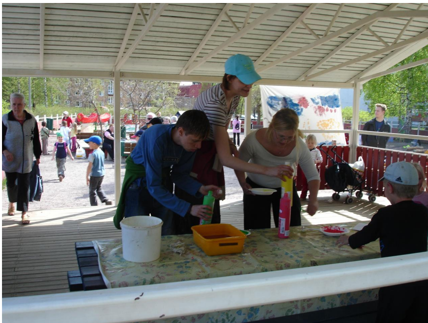
KUVIO 6. Sormet maalissa: Kalliomaalaus syntyy yhteistyössä.

Ostimme hankkeen varoista keltaista, punaista ja vihreää sormiväriä, joita jaettiin lapsille syvistä paperilautasista. Osan sormiväreistä lainasimme Leikkipuisto Maunulasta. Pöydän ja puisen lattian suojasimme isoilla vahakankailla, jotka saimme lainaksi leikkipuistosta. Saimme lainaksi myös saavin ja käsipaperia, jolloin lapset pääsivät sormivärejä käsiteltyään pesemään kätensä. Haavikon opiskelijat auttoivat lapsia maalauspuuhassa. Palkinnoksi osallistumisesta seikkailuun Haavikon opiskelijat jakoivat katoksen alla lapsille mitalit.