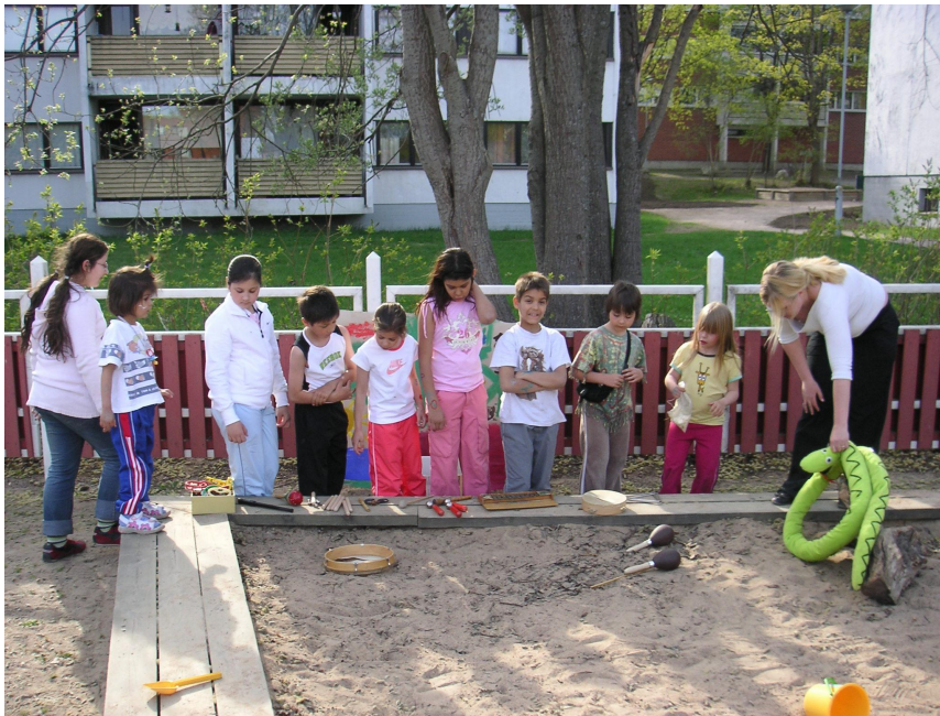
KUVIO 5. Soittimet soimaan: Surumielinen käärme kaipaa piristystä.

Reitti kolmannelta pisteeltä viimeiselle pisteelle, aidatun alueen nurkassa sijaitsevan avonaisen katoksen alle, kulki hiekkalaatikon ja aidan välissä. Reittiä selkiyttämään, matkan varrelle niittasimme kankaan, joka oli Haavikon opiskelijoiden yhteistyössä taiteilema värikäs taideteos. Ennen viimeiselle pisteelle pääsyä joutuivat lapset vielä ylittämään, alittamaan tai kiertämään ”hämähäkinseittejä” koskematta niihin. Seitit olivat leikkipuiston välinevarastosta lainaamiamme erikokoisia verkkoja, jotka olimme sitoneet ja teipanneet roikkumaan kiipeilytelineen yhteydessä oleviin tankoihin. Viimeisen verkon kiinnitimme katoksen puisiin rakenteisiin, ja siihen kiinnitimme seikkailijoita ilahduttamaan omista varastoistamme löytyneet hämähäkki- ja leppäkerttupehmolet.