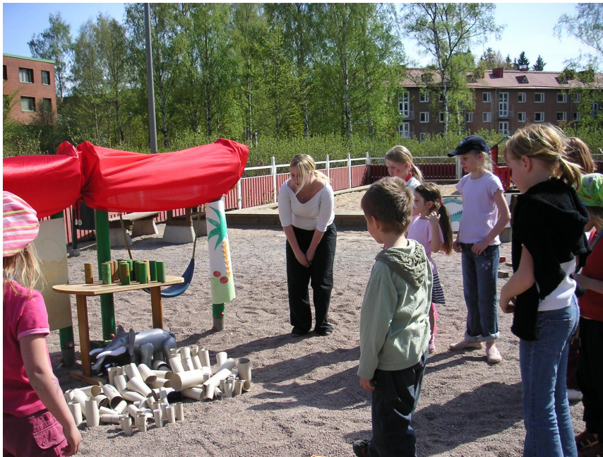
KUVIO 3. Elefanti pulassa: Lapset valmiina pelastustöihin.

Ensimmäisessä pisteessä tarkoituksena oli ”pelastaa elefantin poikanen kallion takaa heittelemällä kookospähkinöillä kallio rikki”. Piste sijaitsi pienen kiipeilytelineen edustalla. Viidakon tunnelmaa lisäämään kiinnitimme telineeseen maalarinteipillä kankaita sekä kartongista askartelemamme vuorimaalauksen. Elefanti oli kuminen lasten uimalelu ja pahvirullat kuvastivat kivenlohkareita, joita lapset heittelivät hernepusseilla. Piste sijaitsi pehmeällä hiekalla, johon pahvirullat oli helppo painaa, eikä tuuli kaatanut niitä niin helposti.