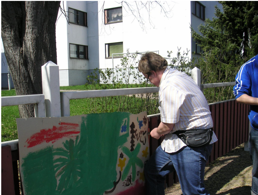
KUVIO 2. Vasaran pauketta: Lavasteita kiinnittämässä Haavikon opiskelija

Menimme sovitusti vastaan kuutta ilmoittautunutta Haavikon opiskelijaa kello 13.00 lähellä sijaitsevaan Haavikon opetus- ja aikuiskasvatuskeskukseen. Aloitimme yhteisen päivän Leikkipuisto Maunulassa lukemalla opiskelijoille viidakkoihaisen kehyskertomuksen (LIITE 3), jonka olimme laatineet seikkailua varten opinnäytetyöryhmämme keskinäisissä tapaamisissa. Kävimme alustavan suunnitelman radan toteutuksesta läpi kohta kohdalta. Seikkailu koostui neljästä erilaisesta toiminnallisesta pisteestä, joista jokaiseen liittyi osio kehyskertomuksesta. Näin ollen pisteet ja tarina muodostivat eheän sekä mielekkään kokonaisuuden. Haavikon opiskelijat esittivät ehdotuksia sekä kertoivat omia näkemyksiään suunnitelman toimivuudesta. Päätimme yhteisesti jokaisen pisteen alustavan paikan. Pisteet oli suunniteltu niin, että ne sopivat yhteen sekä tukivat valitsemaamme viidakkoteemaa.