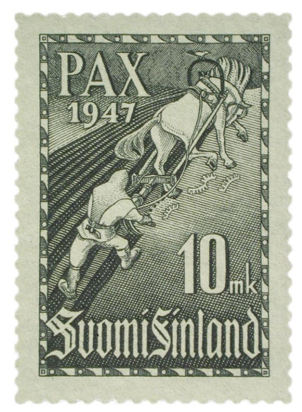
Kuva 9. Pariisin rauhansopimusta muistava suomalainen postimerkki vuodelta 1947.

Presidentti Kekkonen yritti 1960-luvulla saada Neuvostoliiton johtajat keskustelemaan Karjalan alueiden palauttamisesta, mutta yritys ei johtanut konkreettisiin tuloksiin.