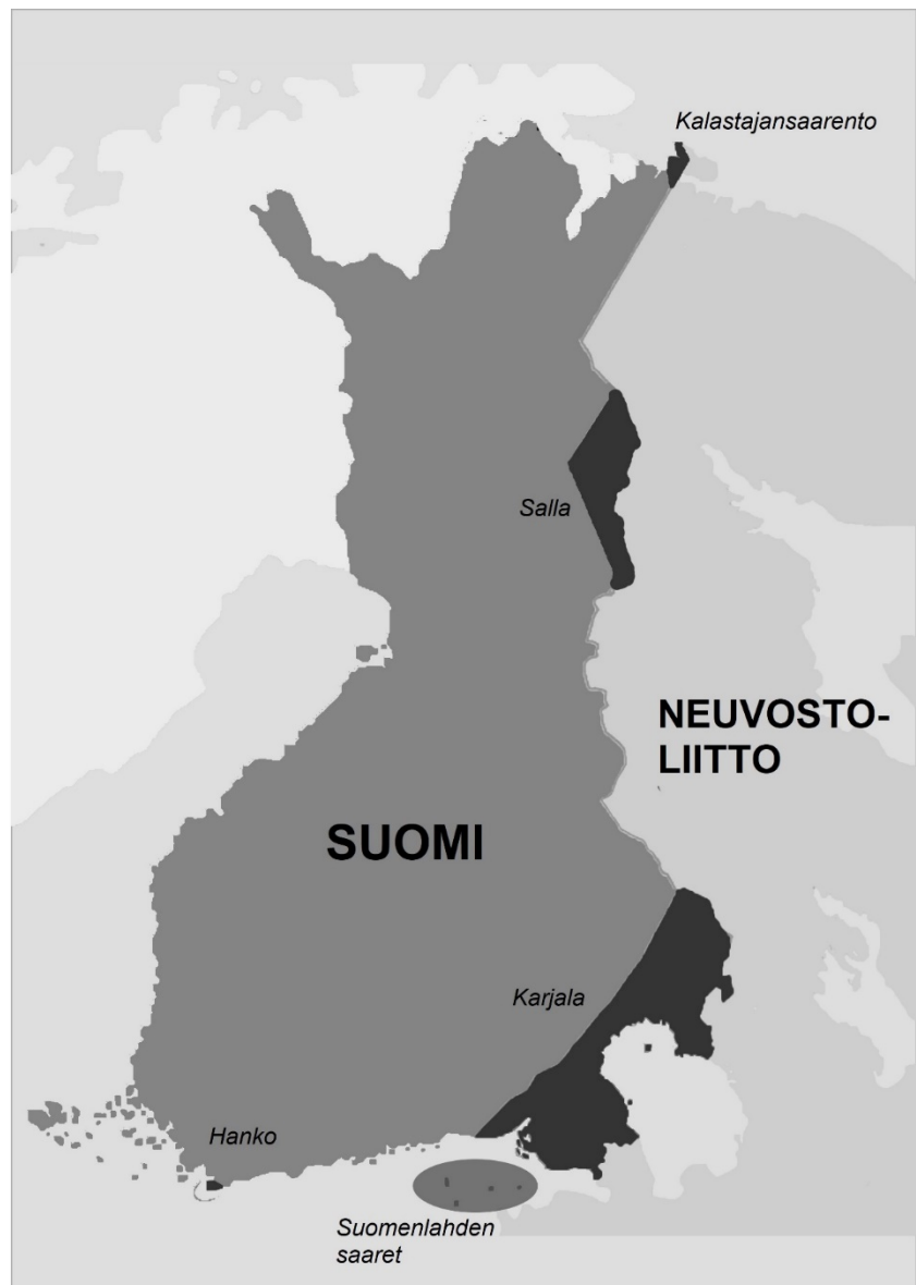
Kuva 3. Suomi talviso- dan jälkeen vuonna 1940.

Lähes kaikki menetetyillä alueilla asuneet asukkaat muuttivat lännemmäksi Suomeen ja tarvitsivat katon päänsä päälle. He menettivät käytännöllisesti katsoen kaiken omai- suutensa. Suomella oli suururakka asuttaa nämä noin 420 000 maahanmuuttajaa.