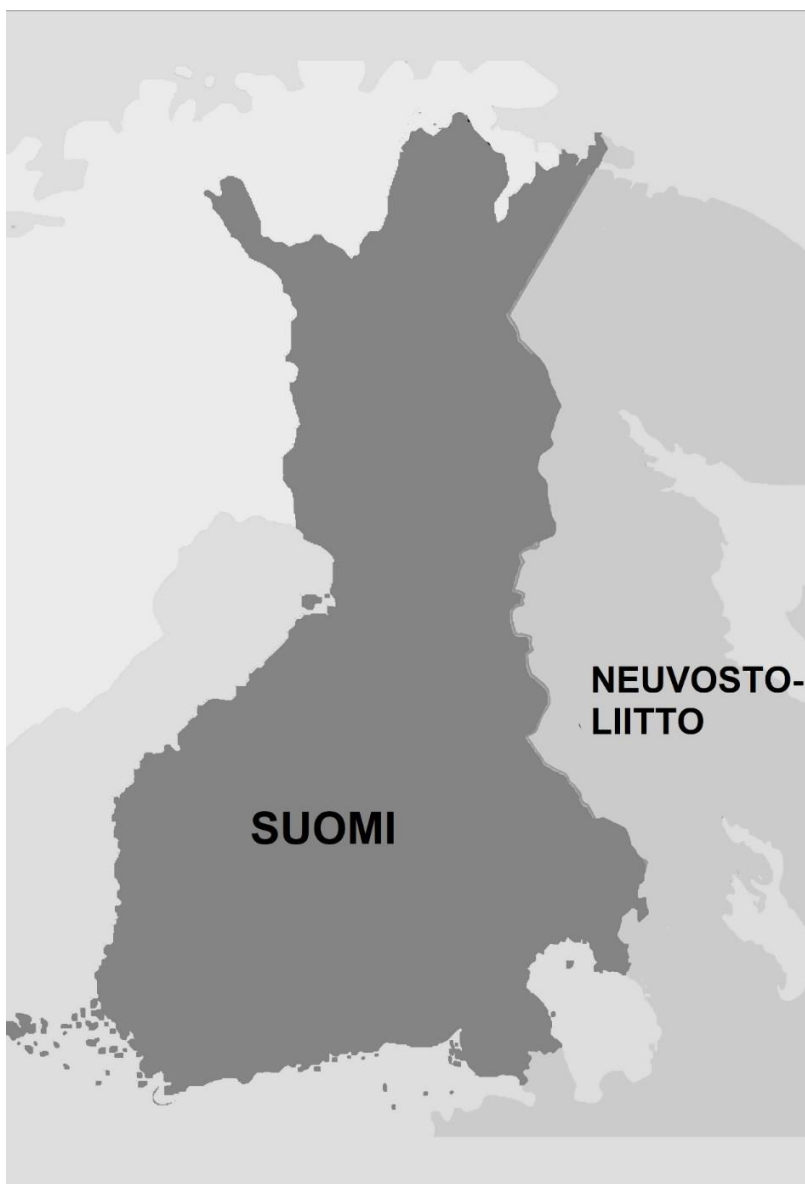
Kuva 2. Vastikään itsenäistyneen Suomen alue vuonna 1920, voimassa vuoteen 1940.

Adolf Hitlerin johtama Saksa, Benito Mussolinin johtama Italia sekä Japani erosivat Kansainliitosta vuosina 1933–1934. Neuvostoliitto puolestaan hyväksyttiin Kansainliiton jäseneksi vuonna 1934 – Suomi äänesti Neuvostoliiton jäsenyyden puolesta. Kansainvälinen tilanne kiristyi 1930-luvun edetessä, sillä Kansainliitosta eronneet kolme valtiota ryhtyivät aggression tielle hyökkäämällä naapurivaltioidensa kimppuun tai pakottamalla ne myönnytyksiin. Saksa ja Neuvostoliitto pitivät toisiaan ideologisina verivihollisina. 18