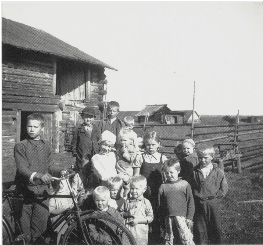
Kuva 6. Lapsia Pohjois-Aunuksen nimeämättömässä kylässä.

Kun neuvostoliittolainen sotilas joutui sotavangiksi, hänen reittinsä kulki divisioonan tasolle perustettujen kokoamispaikkojen kautta armeijakunnan alaisiin järjestelypaikkoihin. Sieltä matka jatkui edelleen rintamasta kauempana sijaitseviin sotavankien järjestelyleireihin, joista heidät siirrettiin varsinaisiin sotavankileireihin tai erikoisleireihin. Jälkimmäisiin – neljään erilaiseen leirityyppiin – sijoitettiin upseerit, suomensukuiset vangit, karkaamisiin syyllistyneet vangit ja poliittinen henkilöstö. Ensimmäisillä kahdella ryhmällä oli helpompaa ja viimeisillä kahdella ryhmällä erityisen vaikeaa, etenkin viimeisellä.