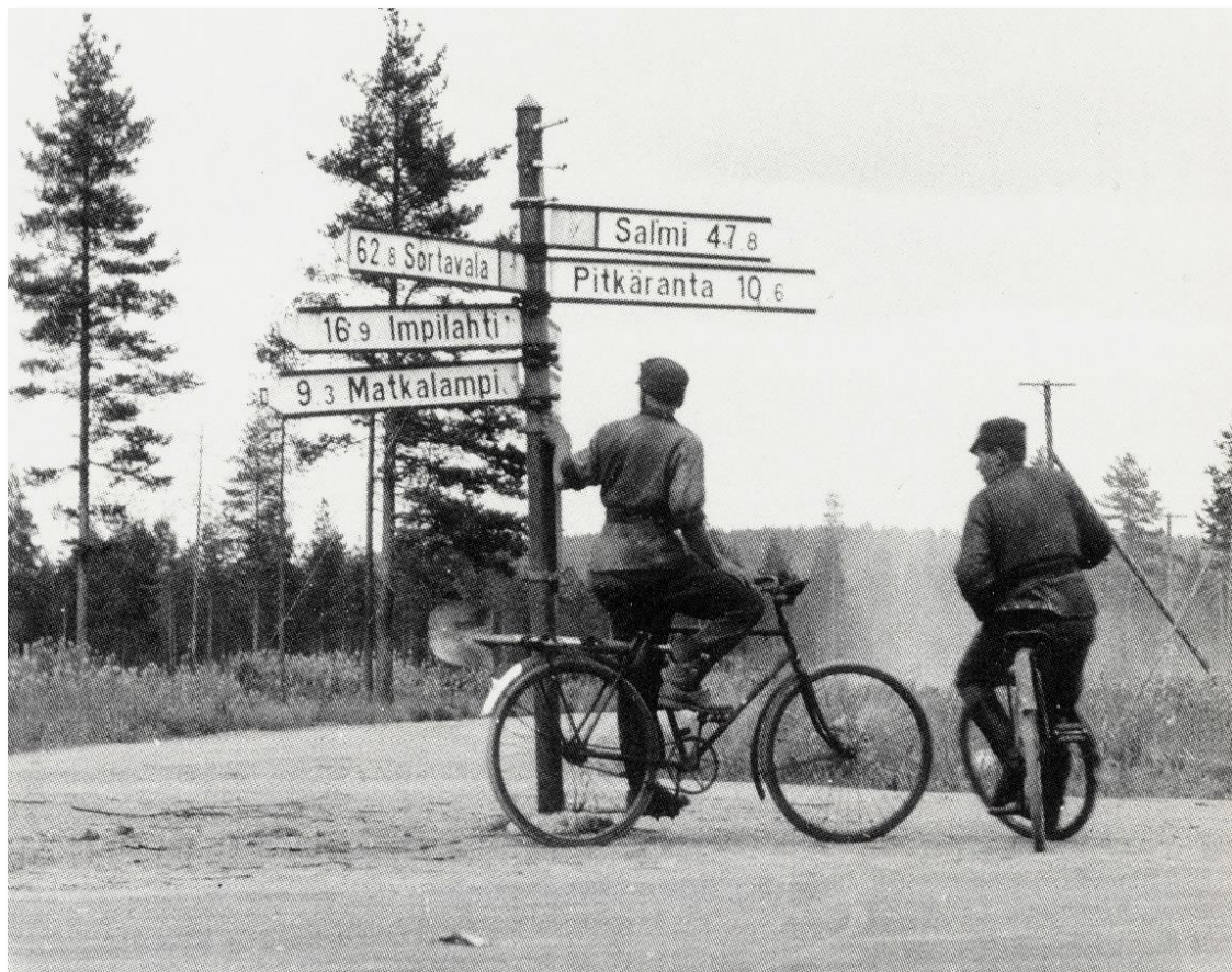
Kuva 7. Sotilaat ovat pysähtyneet Koirinojan tienhaaraan sen jälkeen, kun aselepo Suomen ja Neuvostoliiton välillä solmittiin 4. syyskuuta 1944.

Sodan jälkeinen rangaistusprosessi johti moniin rangaistuksiin, mutta mistään järjestelmällisyydestä ei voida puhua. Monet rikoksiin syyllistyneet upseerit ja vartijat välttivät vastuun. Tätä ei voi valittaa suureen ääneen, sillä voittajavaltioiden leireilläkin tapahtui rikoksia, mutta useimmat syylliset välttivät vastuun.