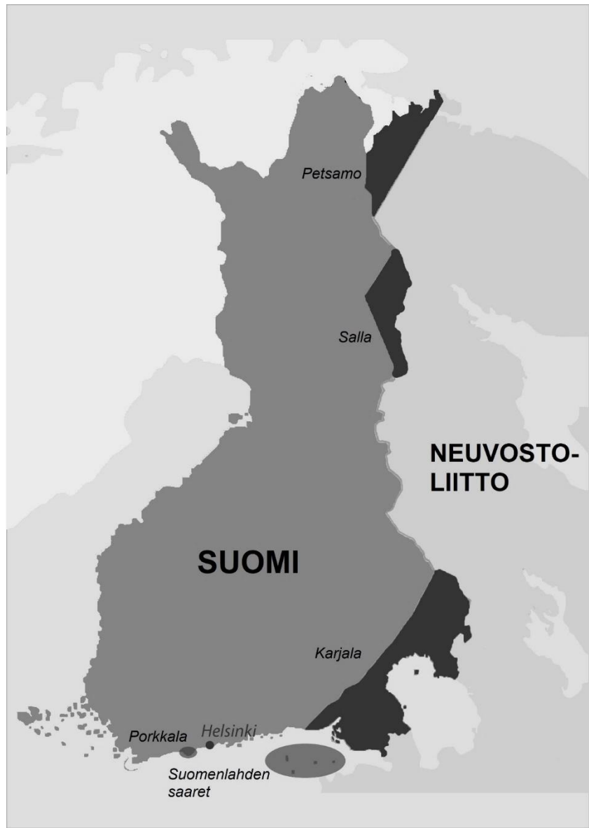
Kuva 5. Suomen alue jatkosodan jälkeen vuonna 1944. Alue- menetykset vahvisti Pariisin rauhansopimus.

Kun Suomen armeija ylitti valtiorajan kesän 1941 jälkipuoliskolla, se teki sen maksimivoimalla. Suomi oli valmistautunut valtaamaan vierasta aluetta. Syksyn kuluessa kävi selväksi, että Suomi oli ylittänyt kestämyksensä ja joutui supistamaan armeijaansa. Harjoitetun sotapolitiikan seurauksena maa ajautui ravintopulaan. Suomi oli näet kärsinyt suuresti talvisodasta ja joutui asuttamaan yli 400 000 henkilöä, jotka muuttivat pois Neuvostoliiton valtaamilta alueilta. Kesällä 1941 Suomen ravintotilanne oli melko hyvä, mutta ei niin hyvä, että kesän satokautena lähes kaikki 19,5–45-vuotiaat miehet voitiin määrätä sotapalvelukseen. Sato jäi normaalia pienemmäksi ja ravintopulasta kärsivät etenkin leireihin suljetut ihmiset, joita kuoli tuhansittain nälkään ja epidemioihin.