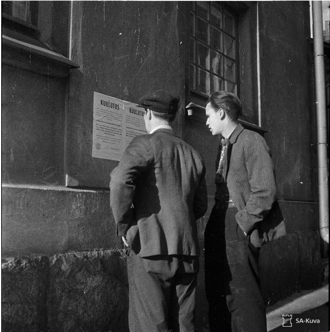
Kuva 1. Kuulutusta yleisestä liikekannallepanosta tarkastellaan Helsingissä 20. kesäkuuta 1941.

Vaikka kehittyneeseen kansalliseen oikeuteen verrattuna kansainvälinen oikeus oli (ja on) puutteellinen oikeusjärjestelmä, muodollisesti se oli (ja on) kansallisen oikeuden yläpuolella. Valtio ei voinut vedota kansalliseen lakiinsa perusteeksi hyväksymänsä kansainvälisoikeudellisen velvollisuuden rikkomiselle. Jos se olisi ollut mahdollista, kansainvälinen oikeus olisi menettänyt merkityksensä lähes täydellisesti. 6