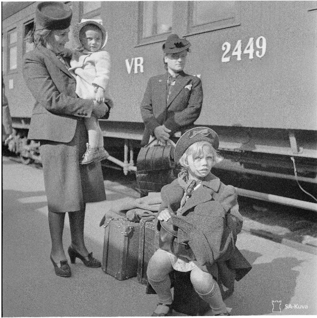
Kuva 4. Lapset odottavat matkaa kesälaitumelle Helsingin päärautatieasemalla 20. kesäkuuta 1941.