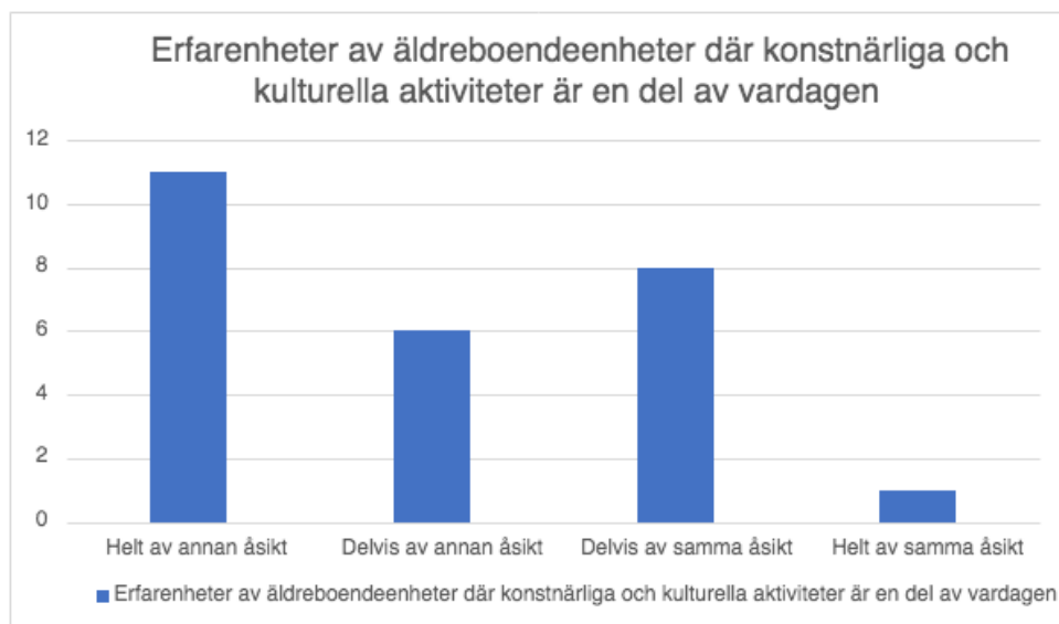
Figur 3. Diagrammet presenterar studerandes svar på frågan "Jag har erfarenheter från en äldreboendeenhet där konstnärliga och kulturella aktiviteter var en del av arbetsvardagen"