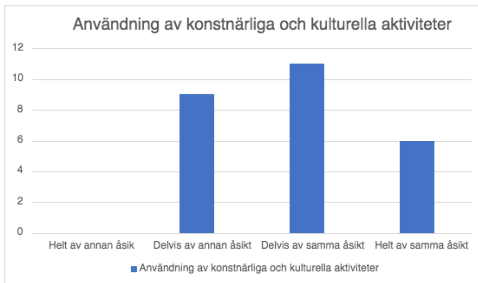
Figur 2. Diagrammet presenterar studerandes resultat på frågan "Jag kan använda mig av konstnärliga och kulturella aktiviteter inom äldreården"

När det kommer till erfarenhet av att jobba på en äldreboendeenhet där konstnärliga och kulturella aktiviteter är en del av arbetsvardagen verkar de flesta av deltagarna inte ha någon sådan erfarenhet, då 11 personer indikerat att de var av helt annan åsikt . Åtta personer verkar åtminstone delvis ha erfarenhet av konstnärliga och kulturella aktiviteter ute på fältet och en person har uppgett att hen var av helt samma åsikt . Medelvärdet på svaren är 1,96. Medianen är 2. Både medelvärdet och svaret som mest frekvent besvarades av deltagare är låga i jämförelse med svaren på de två första frågorna. Resultatet kring erfarenhet från en äldreboendeenhet där konstnärliga och kulturella aktiviteter var en del av vardagen presenteras i Figur 3 nedan.