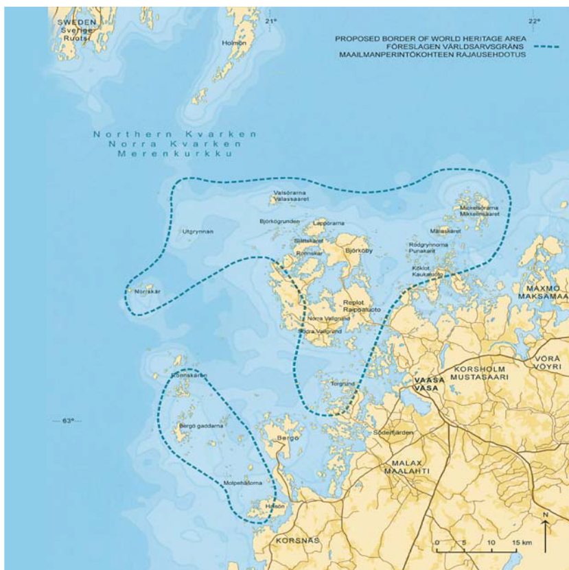
Figur 1. Världsarvet markerat. De fem kommunerna Korsnäs, Malax, Vasa, Korsholm och Vörå-Maxmo.

"Visionen är att Kvarkens skärgård år 2020 ska vara: Ett välkänt världsarv med ett unikt geologiskt landskap, som erbjuder en attraktiv miljö för invånare och genuina upplevelser för besökare". Världsarvsdelegationen för Kvarkens skärgård.