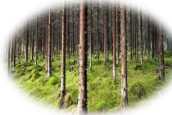
Träd och konstruktion