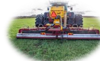
Land- och skogsmaskiner