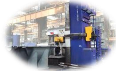
Metall och plast