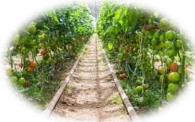
Mat från naturen