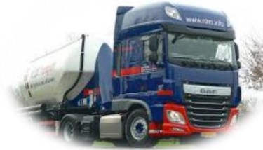
Transport och Logistik