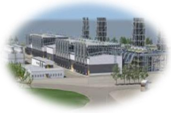
Energi, Clean Tech