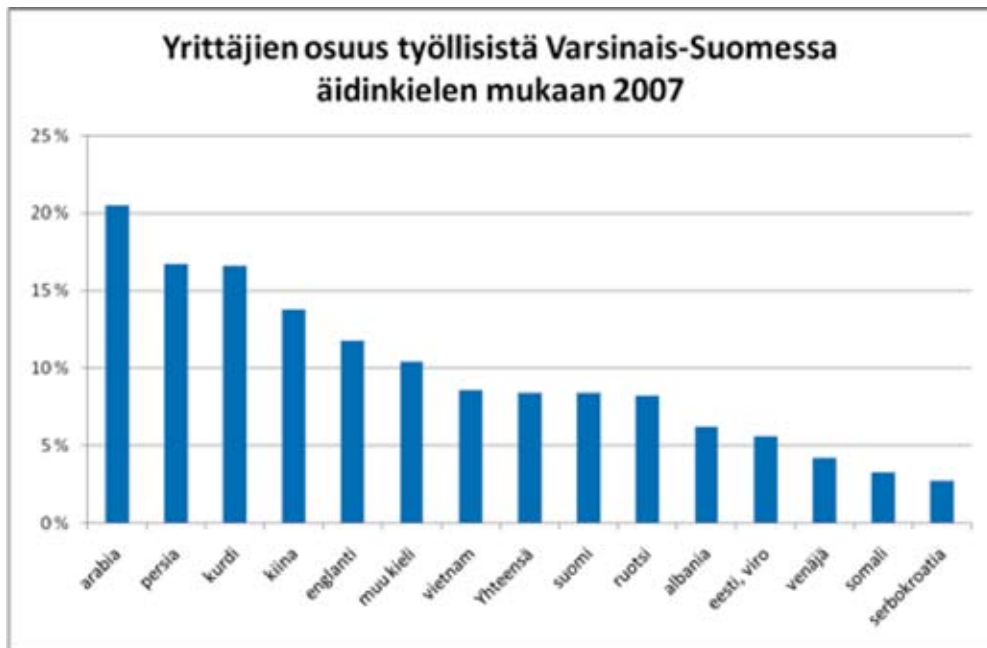
Tilasto 2 (Tilastokeskus 2010).

Yritystiedot ovat Suomessa julkisia ja esimerkiksi osa kaupparekisterin tiedoista on vapaasti saatavilla internetissä, tai kaupparekisteristä on mahdollista tilata poimintoja eri yrityksistä. Rekisteristä ei kuitenkaan löydy tietoja maahanmuuttajayrittäjistä äidinkielen perusteella, vaan yrityspoiminnat voidaan tehdä kansalaisuuden perusteella. Kaupparekisteristä on siis mahdollista saada tieto siitä, kuinka moni yritys Suomessa on ulkomaan kansalaisten omistuksessa. Sen sijaan Suomen kansalaisuuden saaneiden maahanmuuttajayrittäjien yrityksistä ei erillisiä tilastotietoja ole saatavilla.