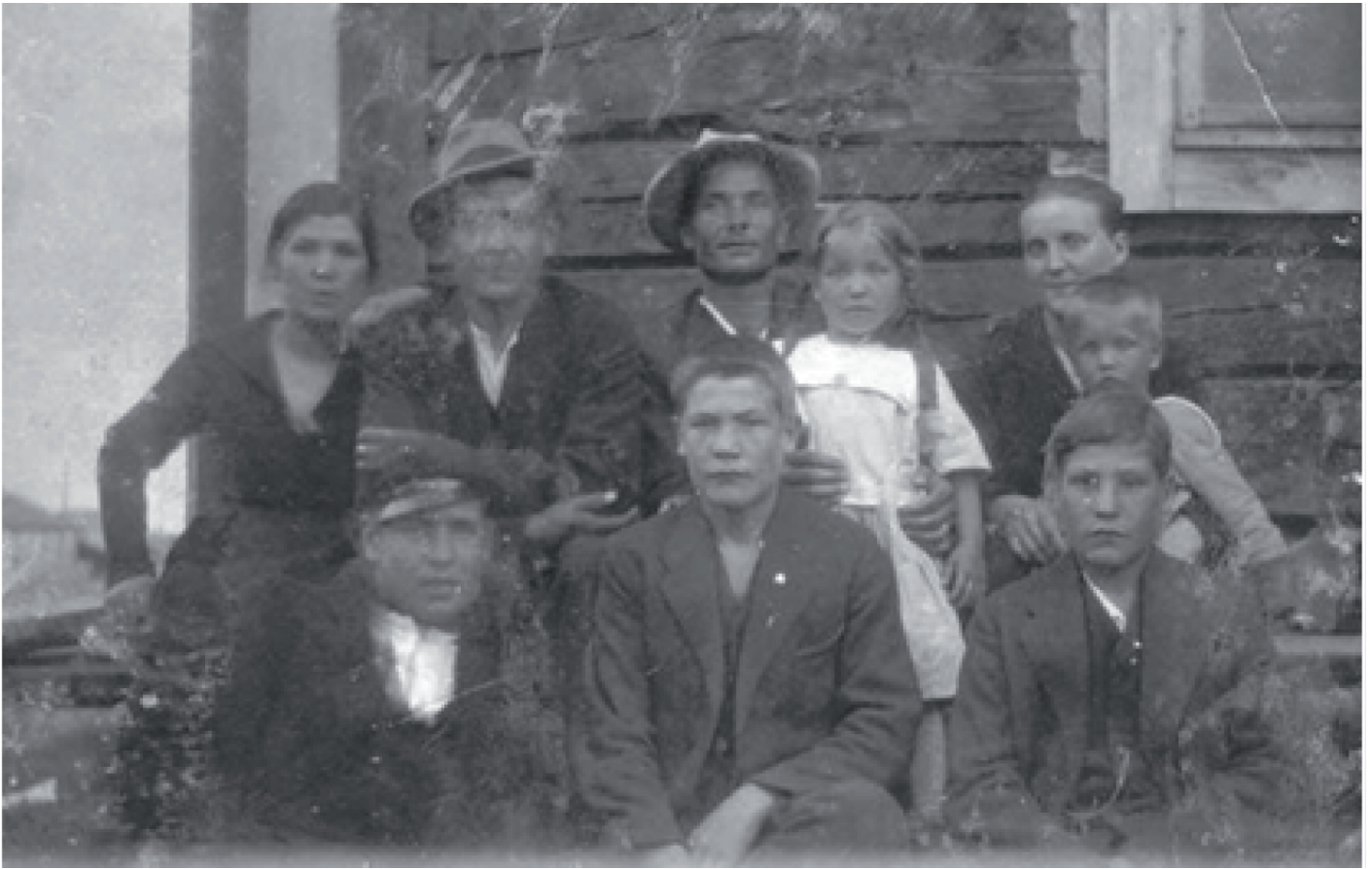
Kuva 4. Fransin sisaruksia ja oma nuori perhe