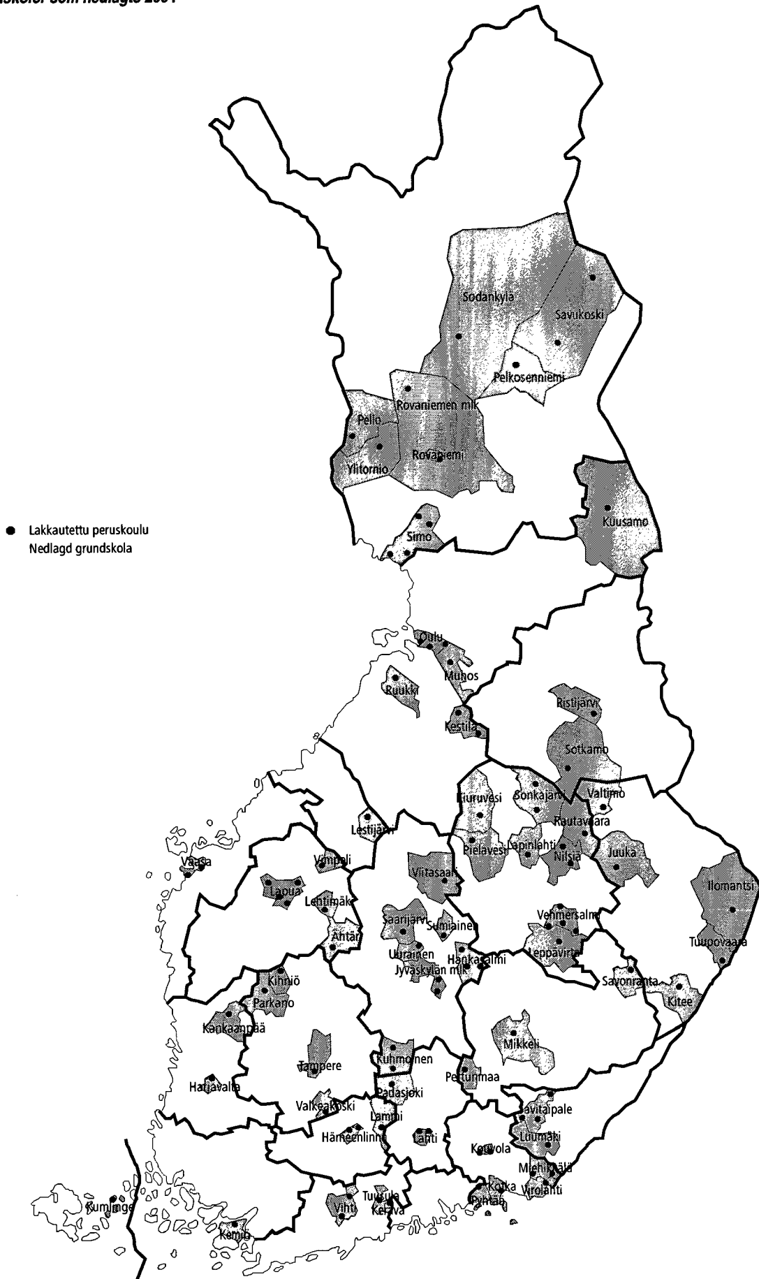
Kuvio 1.2 Lakkautetut peruskoulut 2004 Figur 1.2 Grundskolor som nedlagts 2004