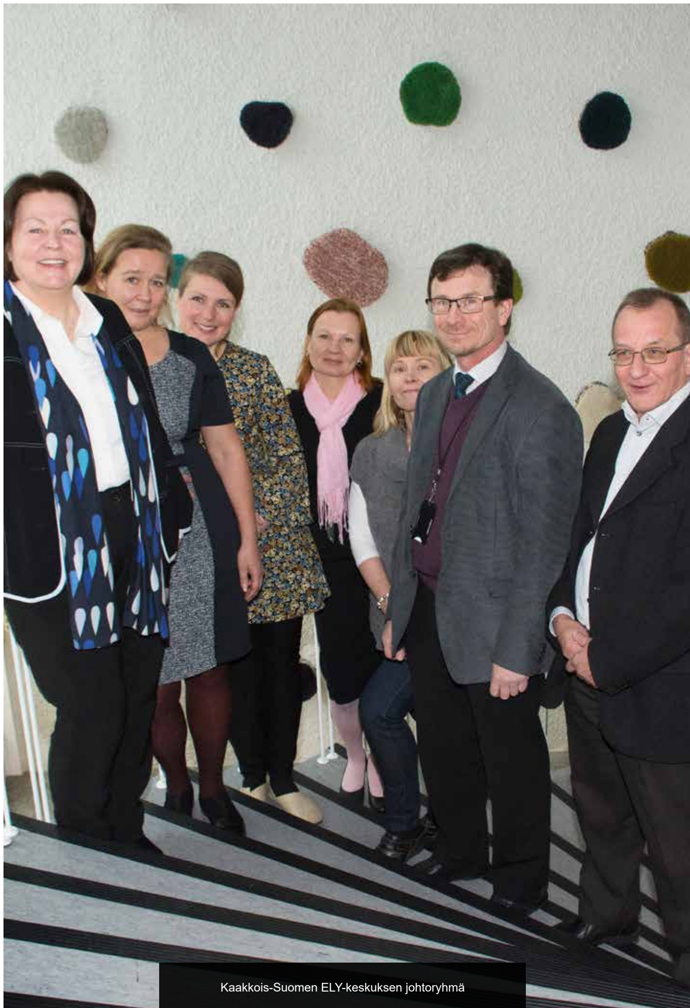
Kaakkois-Suomen ELY-keskuksen johtoryhmä