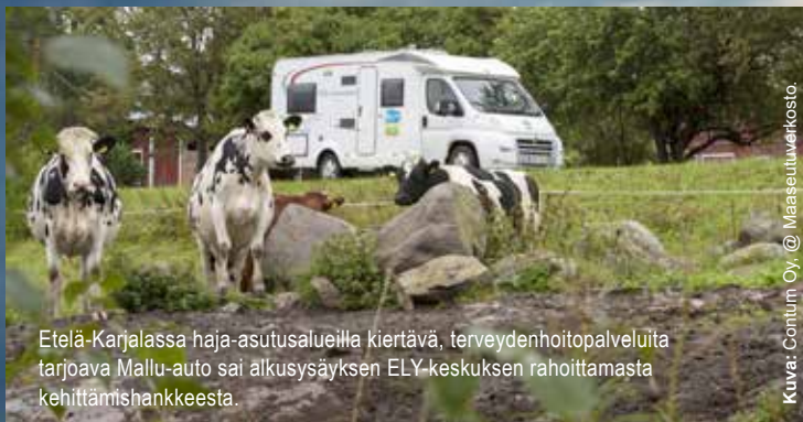
Etelä-Karjalassa haja-asutusalueilla kiertävä, terveydenhoitopalveluita tarjoava Mallu-auto sai alkusysäyksen ELY-keskuksen rahoittamasta kehittämishankkeesta.

ELY-keskuksesta voi saada tukea niin lypsykarjanavetan rakentamiseen kuin metalliyrityksen konehankintaan.