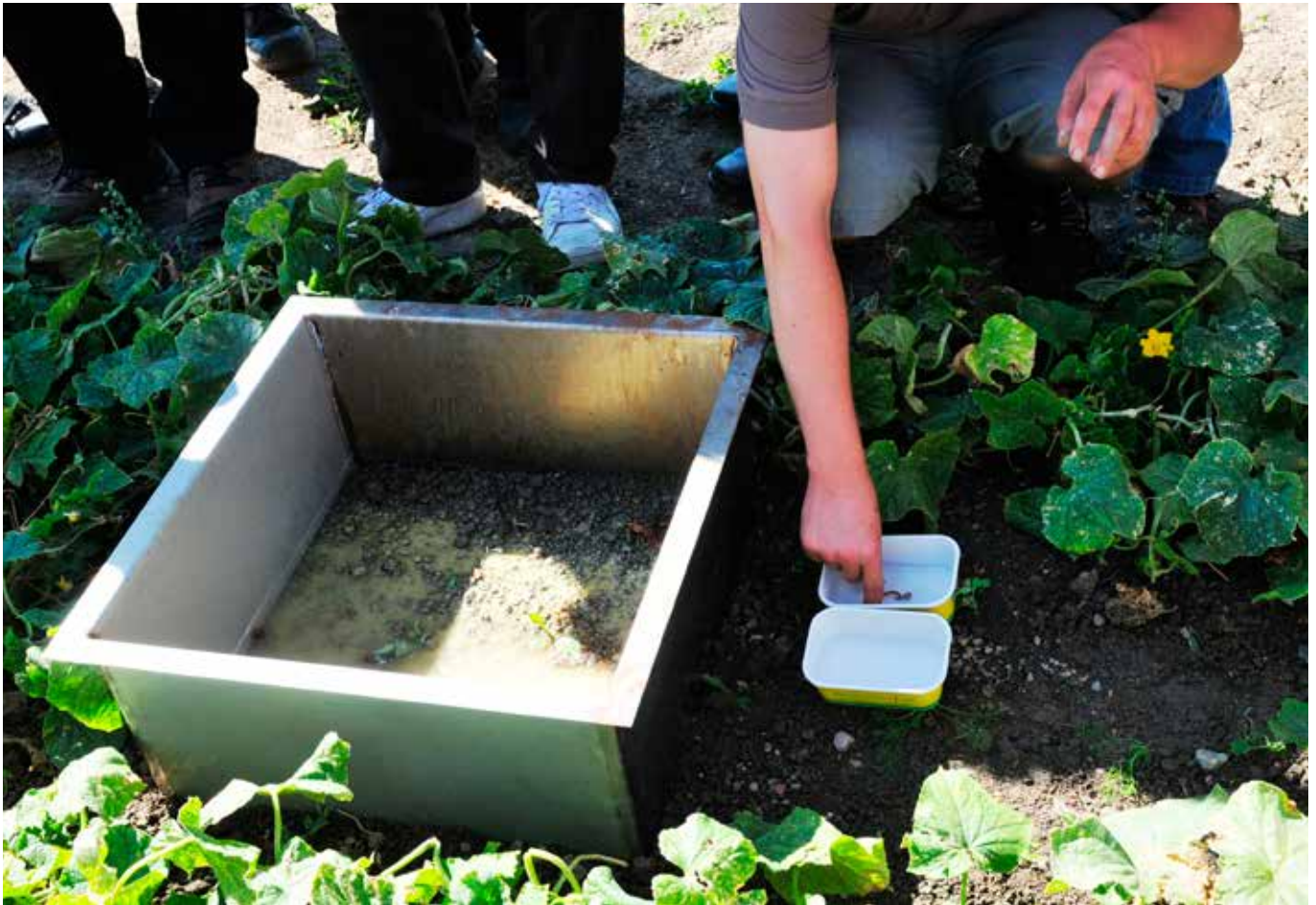
Lierojen esiintymistä maassa voi testata sinappitestillä. Lierot tekevät maahan käytäviä, jotka toimivat veden ja ilman kulkureitteinä. Kuva: A. Launto-Tiuttu.

vuodessa, mikä vastaa muutamien millien maakerrosta (Darwin 1881, Feller ym. 2003, Nuutinen 2011). Suomesta ei ole vastaavia arvioita, mutta lierokannan ollessa tiheä sama suuruusluokka on mahdollinen.