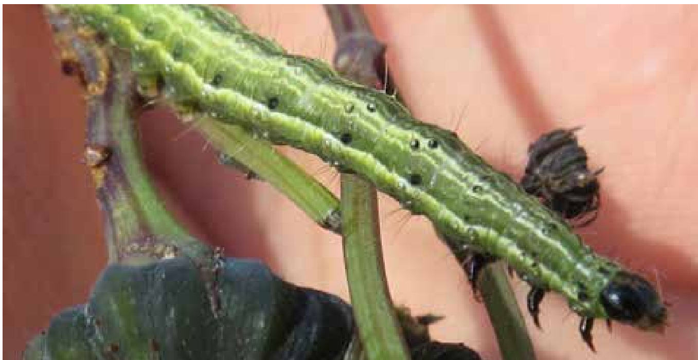
Gammayökkösen toukka voi syödä myös ohdakkeet ja valvatit hengiltä.