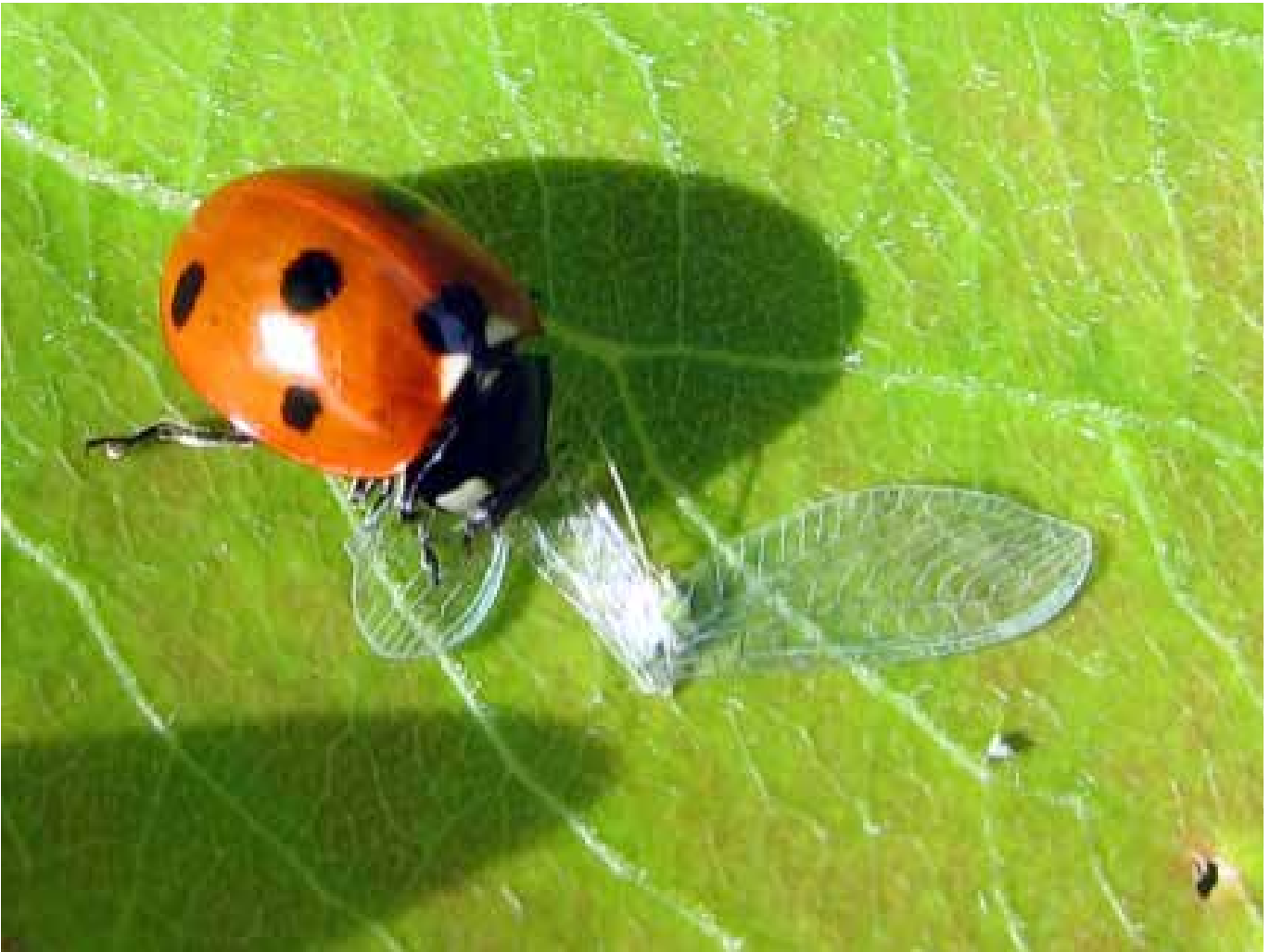
Leppäkerttu on peto, joka syö elinaikanaan 5 000 kirvaa.

maisilla rantapelloilla sekä usein tulvan alle jäävillä pelloilla, joilta ravinteet helpoimmin kulkeutuvat vesistöihin.