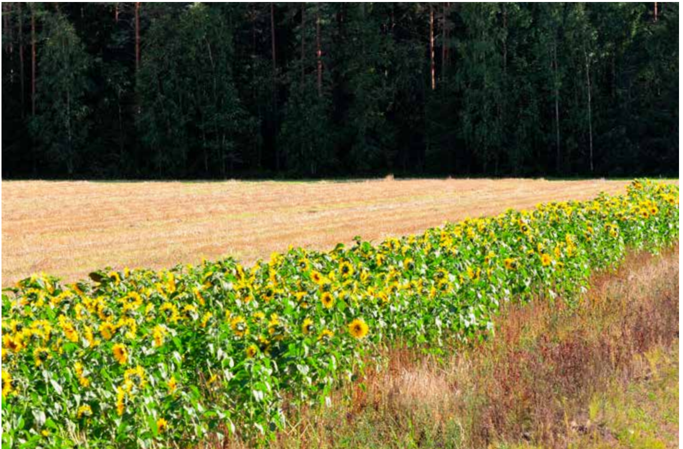
Pelloille kylvetyt kukkivat kaistat tuovat vaihtelua maisemaan ja suosivat pölyttäjiä.

nojen ja aukoiden lajeista 25 % oli taantuneita. Peltojen, pihojen ja joutomaiden päiväperhosissa ei sen sijaan ollut taantuneita lajeja (Pitkänen ym. 2001, Auvinen 2006).