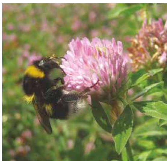
Kimalaiset ovat monien viljelykasvien tärkeitä pölyttäjiä.

Pölyttäjähyönteiset vaikuttavat myönteisesti 150 eurooppalaiseen viljelykasvilajiin (84% kaikista viljelylajeista)