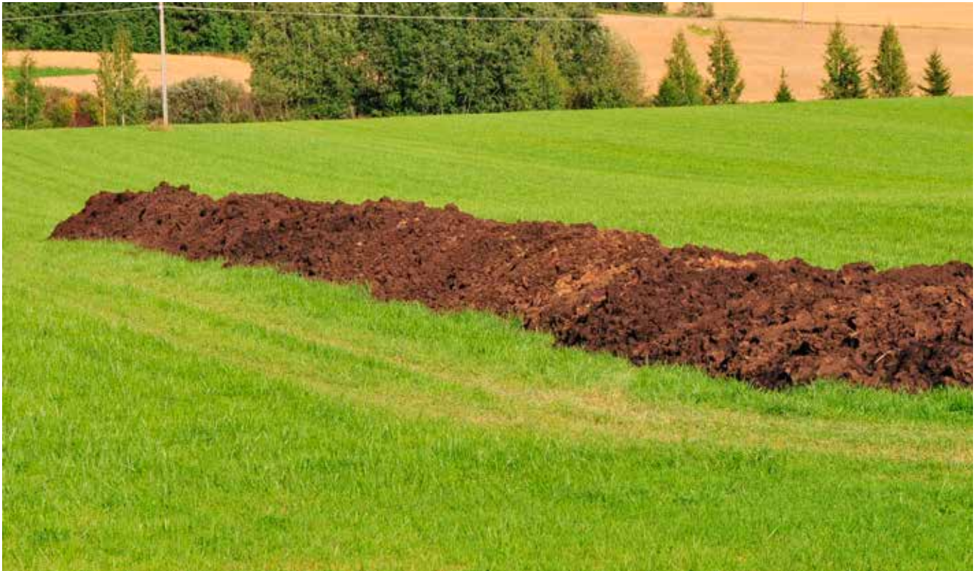
Kuivalanta parantaa maan rakennetta.

viljelyjärjestelmä, viljelykasvit ja sääolot. Paikallisesti korkeita pitoisuuksia esiintyy esimerkiksi lannan levietyksen jälkeen. Suomessa on typpeä metrin syvyydessä maakerroksessa keväällä suurin piirtein 22–27 kiloa hehtaarilla aitosavimailla ja 45–78 kiloa hehtaarilla turvemailla (Känkänen ym. 2011). Lounais-Suomen pelloilla 40–98 % vuosittaisesta typen huuhtoutumisesta tapahtuu kasvukauden ulkopuolella ja painottuu sadonkorjuun ja maan routimisen väliseen ajanjaksoon. Myös keväällä roudan sulamisen jälkeen voi huuhtoutua huomattavia määriä typpeä (Rankinen ym. 2007).