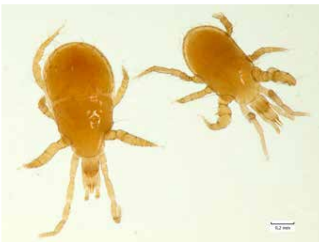
Petopunkkeja käytetään kasvihuoneviljelyssä esimerkiksi ripsiäisten ja kehrääjäpunkkien torjuntaan.

Tuho- ja hyötyeliöt liikkuvat luonnon- ja peltoympäristön välillä pitkin kasvukautta. Valtaosa näistä lajeista ei esiinny pellon puolella, mutta lyhyitäkin matkoja lentävät lajit voivat liikkua paljon. Erilaiset reunat ja muut esteet vaikeuttavat liikkumista; ruohoinen peltotie ei ole merkittävä este, mutta soratie jo on. Luontaisten vihollisten liikkumiskyvyllä ja -mahdollisuuksilla on merkittävä rooli tuholaiskantojen kurissapitämisen kannalta. Esimerkiksi maakiitäjäisten leviäminen kevätiljapelloille keväällä voi kestää viikkoja. Ne talvehtivat piennaralueilla tai nurmissa, mistä ne orastumisen myötä leviävät pellolle. Ne eivät leviä ennen kirvojen saapumista kuin noin 25 m pientareelta pellolle päin, jolloin kauempana pellolla on ”petotyhjiö” ja kirvojen kannankehitys voi tapahtua melko rajoituksetta. Ratkaisuksi on esitetty ”petopankkia”, joka olisi esimerkiksi viljelyaukealla 1,5–2 m ympäristöä korkeammalla oleva, vaikka keinotekoinen piennar, josta petolajit pääsisivät vaivatta leviämään pelloille kasvukauden alussa (Hokkanen 2012).