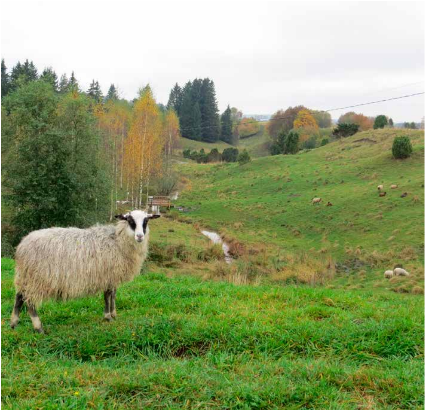
Laiduntavat eläimet pitävät maiseman avoimena.

tainen, ehkä vaikeammin hahmotettava palvelu on biologinen säätely, jonka korkeimmalla tasolla petoeläimet ylläpitävät lajistossäätelyä. Hyönteisten ja muiden selkärangattomien toiminta ekosysteemissä usein jopa unohdetaan. Biologisen kontrollin olemassaolo vähentää tarvetta tuholaisten torjunta-aineiden käyttöön. Ekosysteemipalveluilla on näin taloudellista merkitystä. Esimerkiksi kastemadot pitävät elintavoillaan yllä maaperän kuohkeutta ja kasvuvoimaa (Hiedanpää ym. 2010). Pölyttäjähönteisten tuottama taloudellinen hyöty on Euroopassa vuosittain noin 22 miljardia euroa (www.step-project.net, Liite 1). Ekosysteemipalvelut tarjoavat kansalaisille mahdollisuuden metsästykseseen, kalastukseen, marjastamiseen, mökkimaisemaan sekä