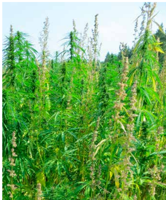
Öljyhamppu on vaatimaton viljelykasvi, joka kasvattaa suuren biomassan. Öljyhamppu vaatii kuitenkin pitkän kasvukauden.

Haastateltava kertoi siemenviljelystarkastajan huomaneen luomukevätvehnässä, että valvattia oli syöty niin, että jäljellä oli pelkkä korsi. Syöjiksi osoittautuivat alku-