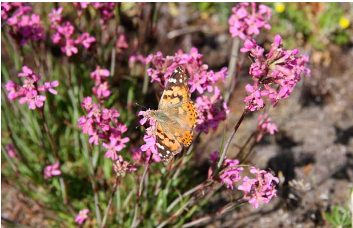
Ohdakeperhonen vaeltaa pitkiäkin matkoja ja viihtyy niityillä.

Maatalousympäristön monimuotoisuus riippuu koko maatalousekosysteemin tilasta ja toiminnasta. Monet maatalousympäristön lajit ovat taantuneet erityisesti viimeisten 30 vuoden aikana, jotkut jopa hävinneet kokonaan maastamme. On myös muistettava, että huomattavan suuri osa uhanalaisista lajeistamme on riippuvaisia kulttuuriympäristöistämme eli perinnebiotoopeista. Uhanalaisuuden syynä onkin yleensä elinympäristön häviäminen (Rassi ym. 1986, 1992, 2001). Eri eläinryhmistä päiväperhosten ja lintujen kantojen kehitys tunnetaan parhaiten. Suomen maatalousympäristöissä esiintyy vakituisesti 74 päiväperhoslajia. Verrattaessa vuosien 1988–2000 esiintymistietoja ennen vuotta 1988 ilmoitettuihin havaintoihin, havaittiin lajeista 43 %:n esiintymisalueen supistuneen, 46 %:n säilyneen ennallaan ja 11 %:n laajentaneen esiintymisaluettaan. Taantuneista lajeista valtaosa oli niitylajistoa. Niityillä ja kedoilla elävistä päiväperhoslajeista 71 % oli taantunut. Metsän reu-